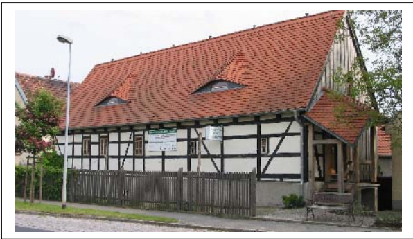
Bild 7 Handarbeitshaus