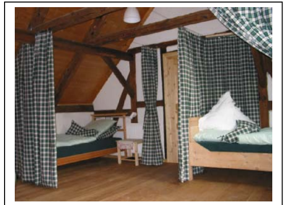
Bild 2 Schlafkojen

2 Schlafräume mit 5 Einzel- und 1 Doppel-Schlafkoje (siehe Bild 2), Bad, WC, Küche, 30 m 2 Wohnarbeitsraum und Terrasse.