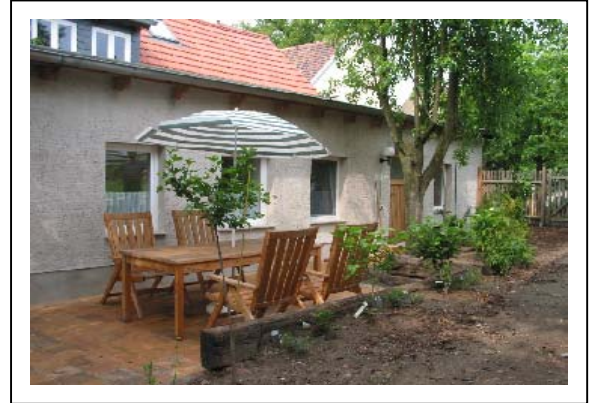
Bild 1 Terrassenansicht

Internet: www.handarbeitshaus-meissen.de