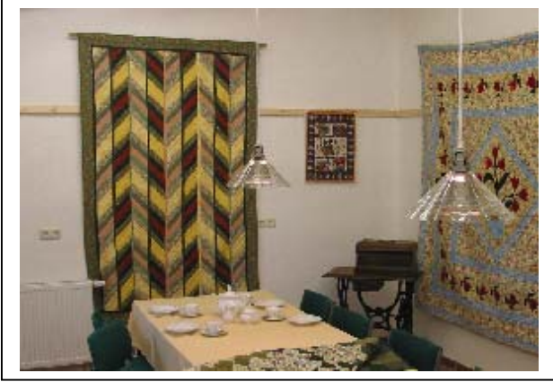
Bild 6 Ausschnitt Wohn- Arbeitsraum

Radeburger Str. 24, 01689 Gröbern bei Meißen