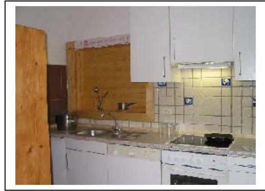
Bild 5 Küche

Einkaufsmöglichkeiten in der näheren Umgebung, nicht im Dorf. Bäcker- und Metzgerwagen kommen 2x die Woche ins Dorf vors Handarbeitshaus. Frische Milch gibt's beim Bauern gegenüber. Kein Telefonanschluss.