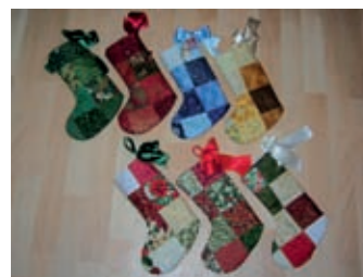
„Stoff-Abo-Quilt“ von Johanna Fölkel

Sie können das Stoff-Abo ganz einfach ausprobieren. Bestellen Sie die aktuelle Ausgabe und erleben Sie das Stoff-Abo. Die Stoff-Abo-Vereinbarung finden Sie unten auf dem Bestellschein.