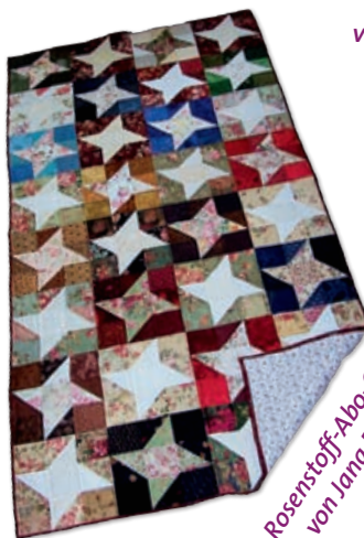
„Rosenstoff-Abo-Quilt“ von Jana Pinkert